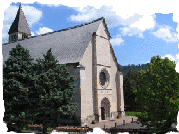
Basilica dei Santi Martiri Sanzeno (TN)

PARROCCHIA PREPOSITURALE di BRIVIO Santi Martiri SISINIO, MARTIRIO e ALESSANDRO